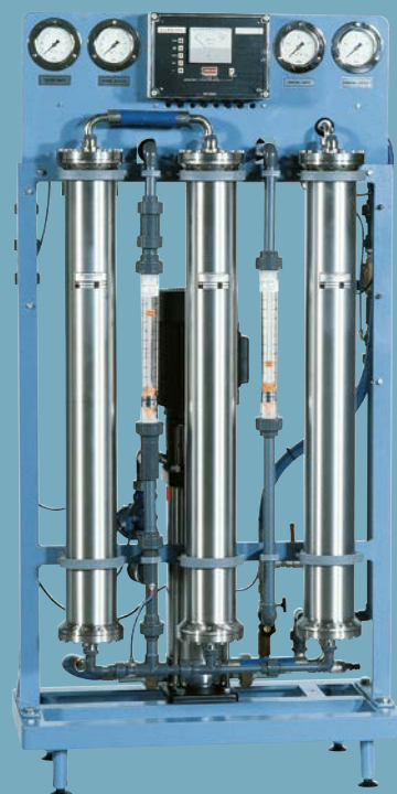
Instalație de osmoză inversă tip EUROTEC 01-3.

Experiența noastră îndelungată și design-ul compact garantează atât o înaltă siguranță a instalațiilor cât și termene de livrare scurte și prețuri competitive.