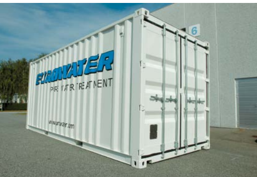
Instalație containerizată de tratare a apei – gata de utilizare. Disponibilă pentru închiriere sau cumpărare.