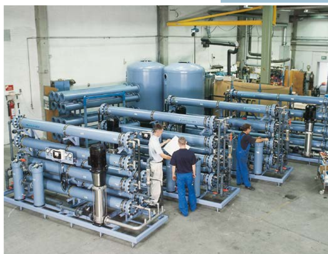
Instalație de osmoză inversă aflată în proces de instalare pentru tratarea apei de cazan la o companie din industria farmaceutică