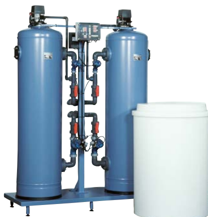
Instalație de dedurizare tip SMH 602