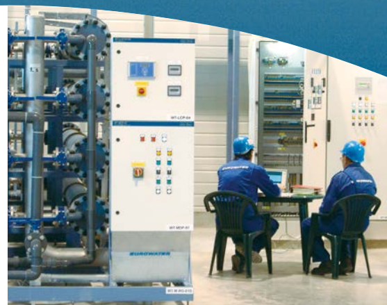
Service preventiv la instalațiile de tratare a apei la un fabricant de automobile.