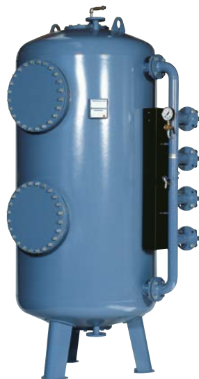
Filtru de presiune tip TFB 14